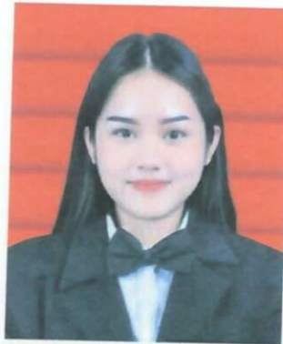
Gambar 1. Foto dengan background warna merah